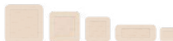
Mepilex Border Flex Lite