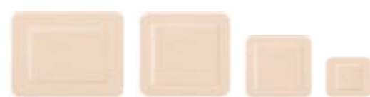
Mepilex Border Flex

Visita www.molnlycke.it per scoprire come le medicazioni Mepilex® Border Flex possono aiutare i pazienti, il personale sanitario e la gestione del budget.