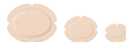
Mepilex Border Flex Oval

Nota: Si prega di contattare il rappresentante Mölnlycke locale per informazioni sui numeri d'ordine disponibili nel proprio paese.